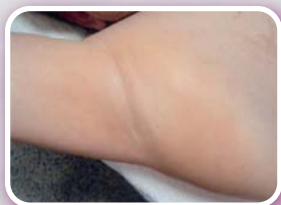
Dopo 4 sedute