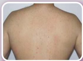
Dopo 6 sedute

L'efficacia di un laser in una luce policromatica